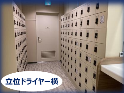
立位ドライバー横