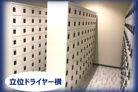
立位ドライバー横